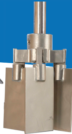
Álabe plegable E-400 cerrado