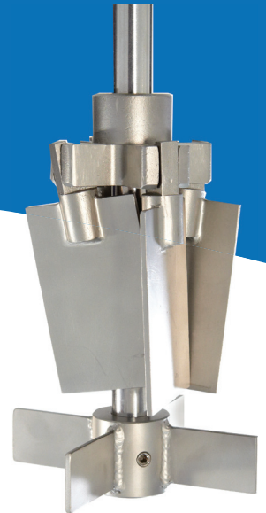
Álabe plegable E-400 con accionador